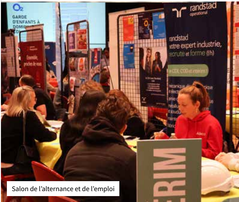
Salon de l'alternance et de l'emploi