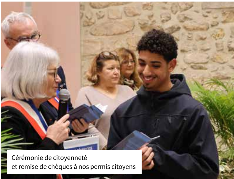
Cérémonie de citoyenneté et remise de chèques à nos permis citoyens