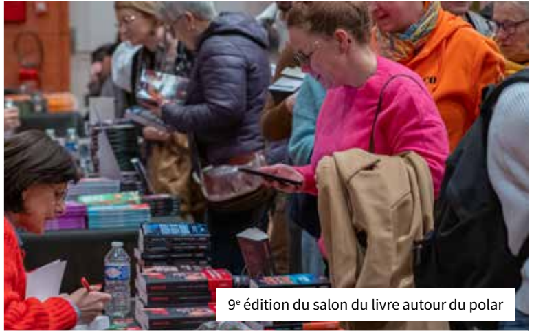
9 e édition du salon du livre autour du polar