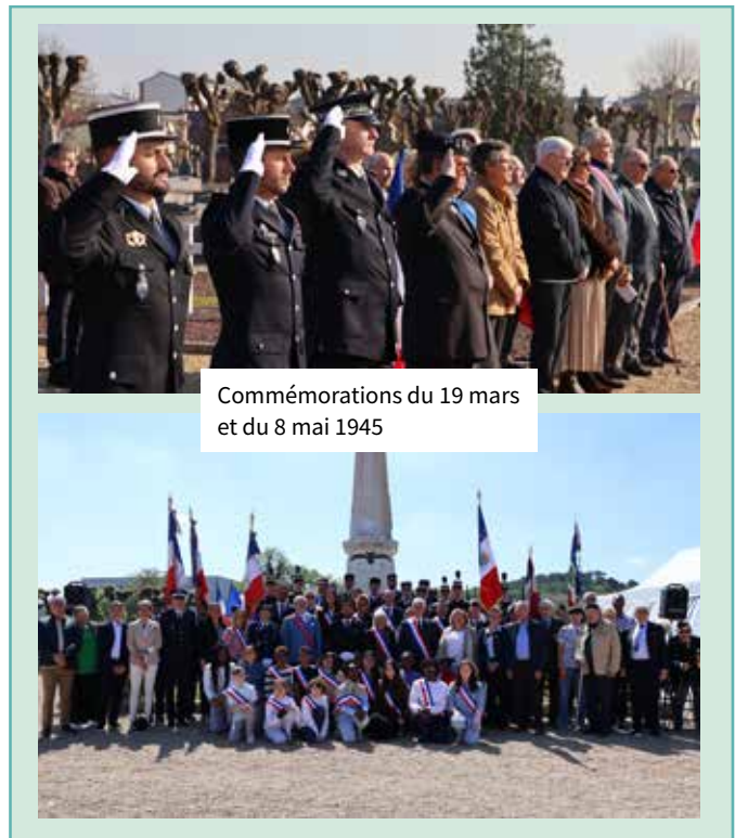
Commémorations du 19 mars et du 8 mai 1945