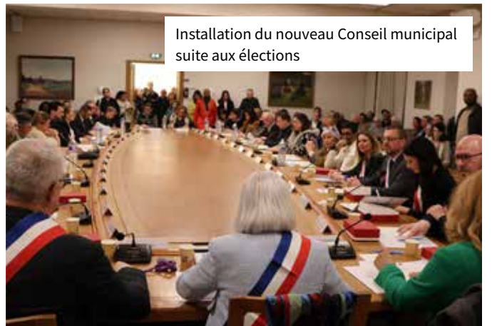
Installation du nouveau Conseil municipal suite aux élections