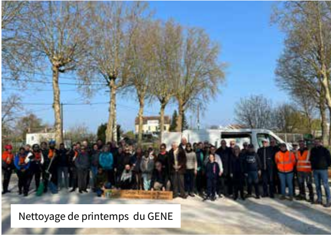
Nettoyage de printemps du GENE