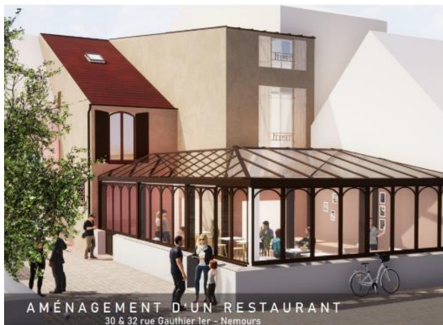
Vue de l'arrière, depuis la cour du Château.

La recherche de l'exploitant est en cours.