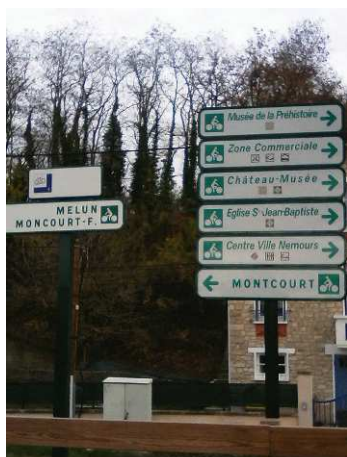
photo du 29 novembre 2018 de la signalétique récemment mise en place

Les conseillers de quartier demandent s'il est prévu à Nemours, une signalétique indiquant les lieux à visiter ? (à l'attention des touristes en vélo)